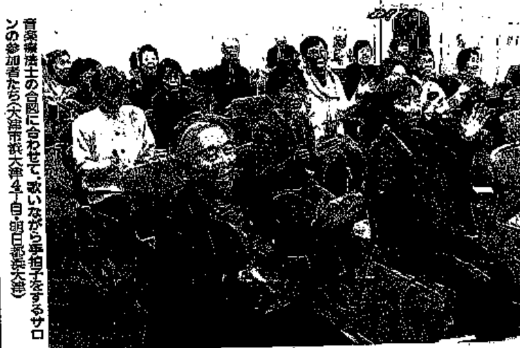
音楽療法士の合同「会」合は、楽しいながら参加者たちの参加者たち大津市大津4丁目・明日香大津